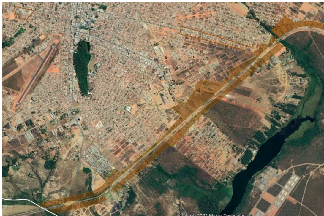
Imagem 1: Em marrom, a Zona de Interesse Logístico (ZIL) em vigor.