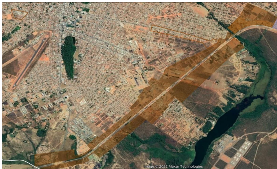
Imagem 2: Em marrom, a Zona de interesse Logístico (ZIL) alterada.